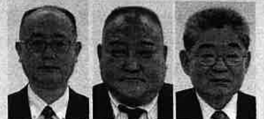
花王(株) (株)東芝 日吉電装(株)